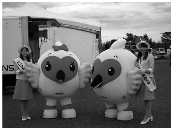
写真-5 「トッキッキ」と「にいがた観光親善大使」

デモ施工および展示説明は，特殊な専門技術を紹介する場であることから，内容が難しく硬い話になりがちなため，新潟県のマスコット「トッキッキ」と新潟市の「にいがた観光親善大使」に，会場を明るく・和やかな場にさせていただきました。