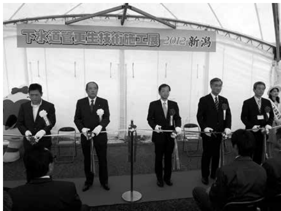
写真-1 開会式のテープカット