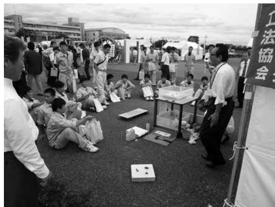
写真-4 見学する新潟県内の学生