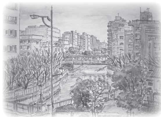
スケッチ：事務所より平久川を臨む