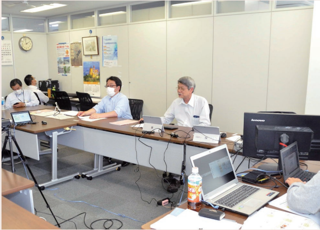
▲ オンラインによる講習会の様子

5月19日(木)、「非開削地下探査技術摘要の手引き」の発行にあたり、Web (Zoom ウェビナー) によるオンライン地下探査技術講習会を開催した。(参加人員60名、関連記事58頁)