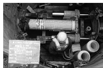
施工状況 (北広島市)