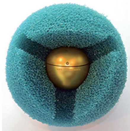
写真-1 スマートボール設置状況

管内に挿入されたスマートボールは、水流に従い管底を転がって移動します。（図-1）スマートボールは管内音を常に記録する役割と、3秒毎に超音波信号を発信して地上のSBR（追跡機器）に受信させる役割があり、地上ではスマートボールの移動状況を把握することが可能です。また、回収地点まで到達したスマートボールは空気弁などの施設を利用し、専用の回収ネットに付属する水中カメラで到達確認およびSBRによるスマートボールの移動停止を確認してから地上に引き上げて現地での調査を完了とします。