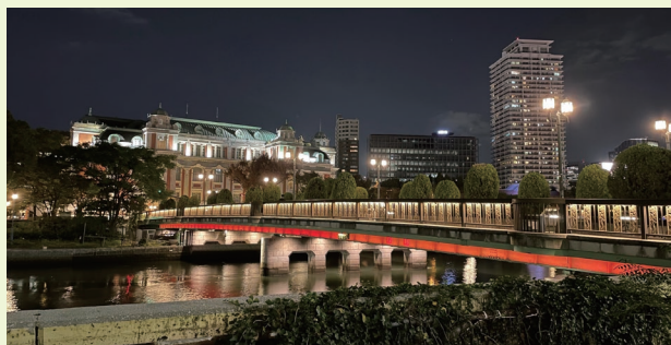
せんだんのまはし 梅檀木橋と大阪市中央公会堂

『天満橋』『天神橋』『難波橋』は、日本夜景遺産にも認定されている浪華三大橋と呼ばれています。夜間にはライトアップされ、水の回廊として美しい光の景観を、是非一度お楽しみいただければと思います