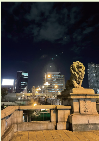
難波橋のライオン像