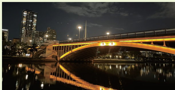
ライトアップされた天神橋