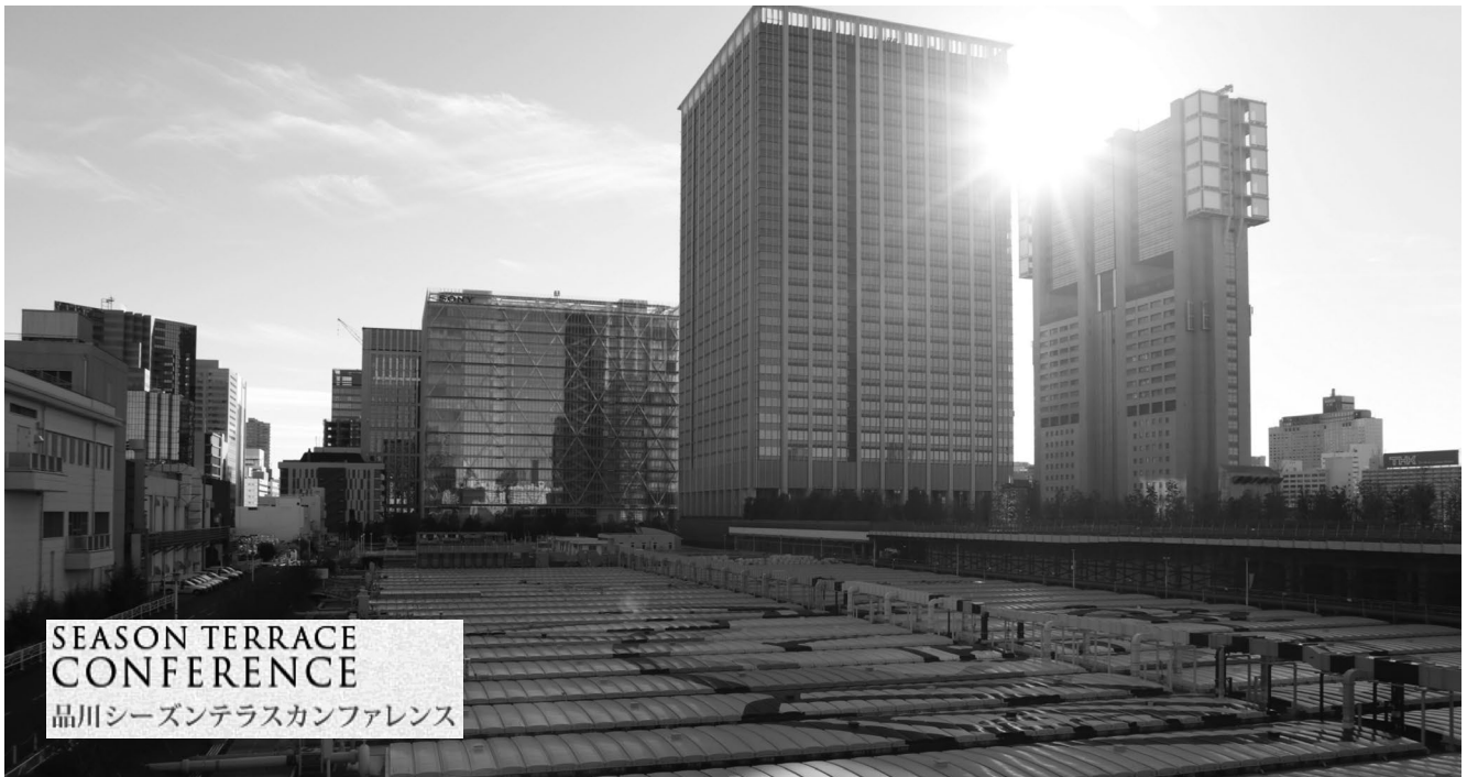
▲ 芝浦水再生センター側から見た今回の会場

に併せ、施設の上部空間を有効利用する計画により2015年に出来た建物ですので、今回の参加費用が東京都下水道局の収入になる仕組みとなっております。当協会では、今回のような大規模講演会をはじめ、非開削技術研究発表会では、下水道ビジネスへの貢献として出来る限りこの施設を利用していきたいと考えております。