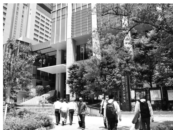
▲ 会場の品川シーズンテラス

な被害が発生した地域などは、おおよそ5年に1回程度発生する規模の降雨に対して、下水道の整備が完了した面積の割合（都市浸水対策達成率）は、2019年度末時点で約6割にとどまっており、豪雨被害が年々拡大していくなかで、下水道設備を含めた流域治水対策が急務であると説明されました。さらに、今年5月に決定された「流域治水関連法」について下水道関係を中心に下水道法の改正内容についてご紹介をいただ