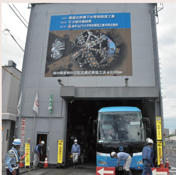
▲ 現場見学会の様子

大阪で下水道展開中の8月18日(水)、19日(木)の2日間、大阪市此花区島屋地区において、呼び径3000、延長283.90mの地中障害物対応型泥濃式推進工法の見学会、および大阪ガス株導管技術センターにおいて体験型研修会を開催しました(関連記事64頁)