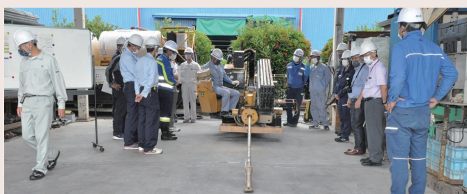
▲ HDD工法の説明を受ける参加者