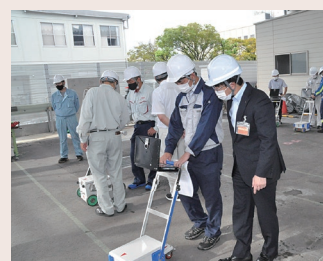
▲ 実機を操作する参加者