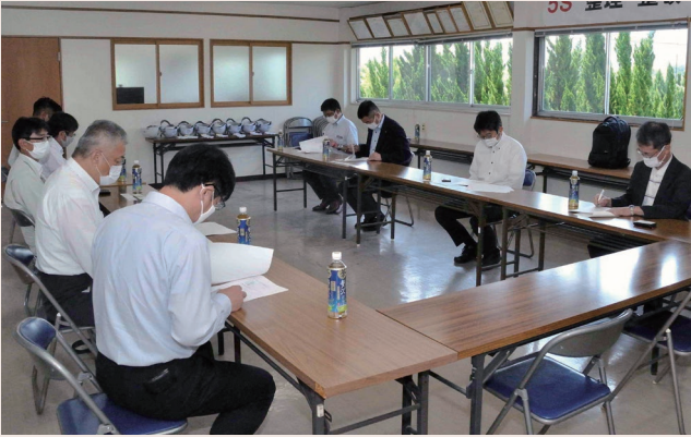
▲ 取材前の概要説明

7月29日(木)、大分県宇佐市・山忠商店(株)／ツルサキヒューム宇佐事業所において、ヒューム管推進工法の掘進機外殻とヒューム管の製造工場取材(関連記事68頁)