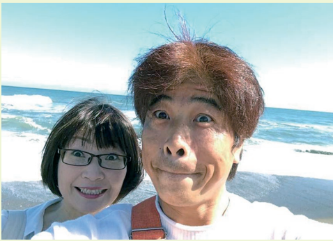
自撮り慣れしていない夫婦。思ったような写真が撮れない