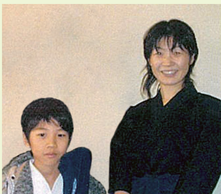
稽古後、疲れ切った私と稽古に慣れている息子