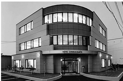
北海道支社社屋（札幌市中央区宮の森）

社内体制は、若手主体の企業風土が出来つつあり、他社と合同若手社員研修会を企画するなど規模の会社のプラットフォームとなり、インフラを維持管理していく上で必要不可欠な企業でありたいと考えております。