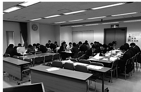
若手社員合同技術研修会