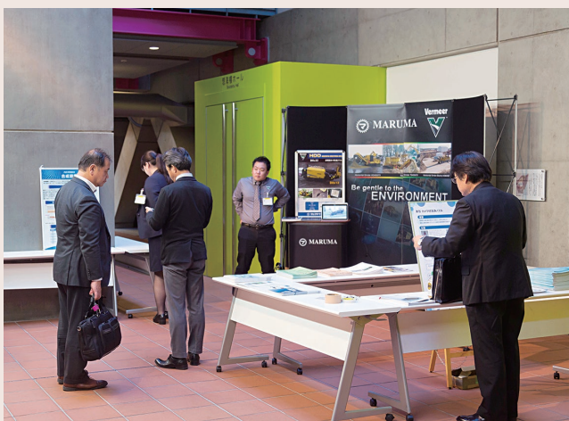
▲ 会場入口に併設された会員展示コーナー