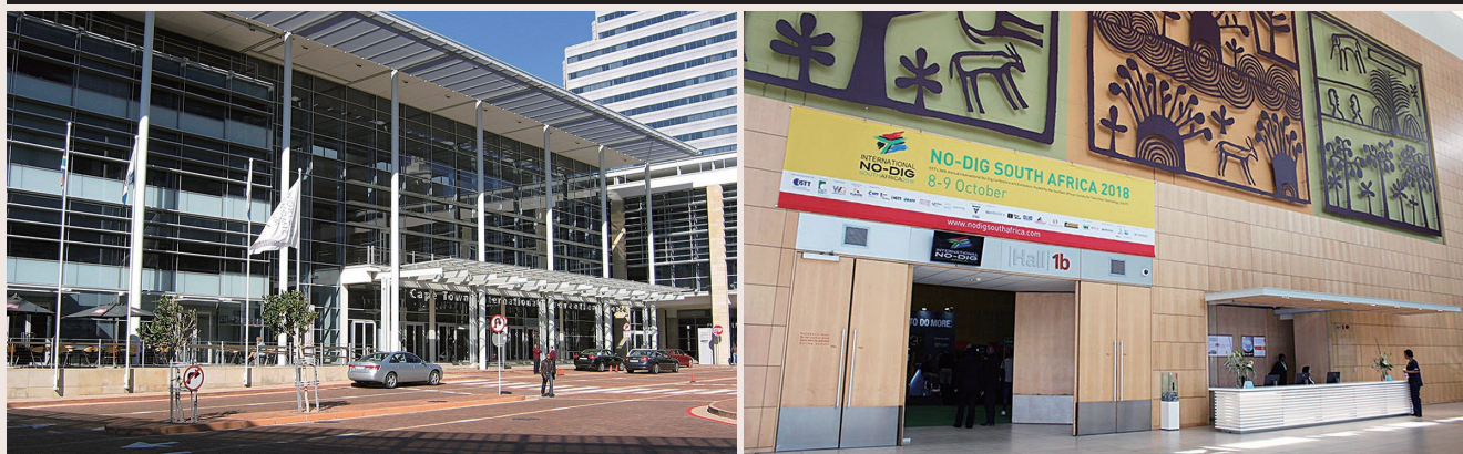
▲ 会場の Cape Town International Convention Center