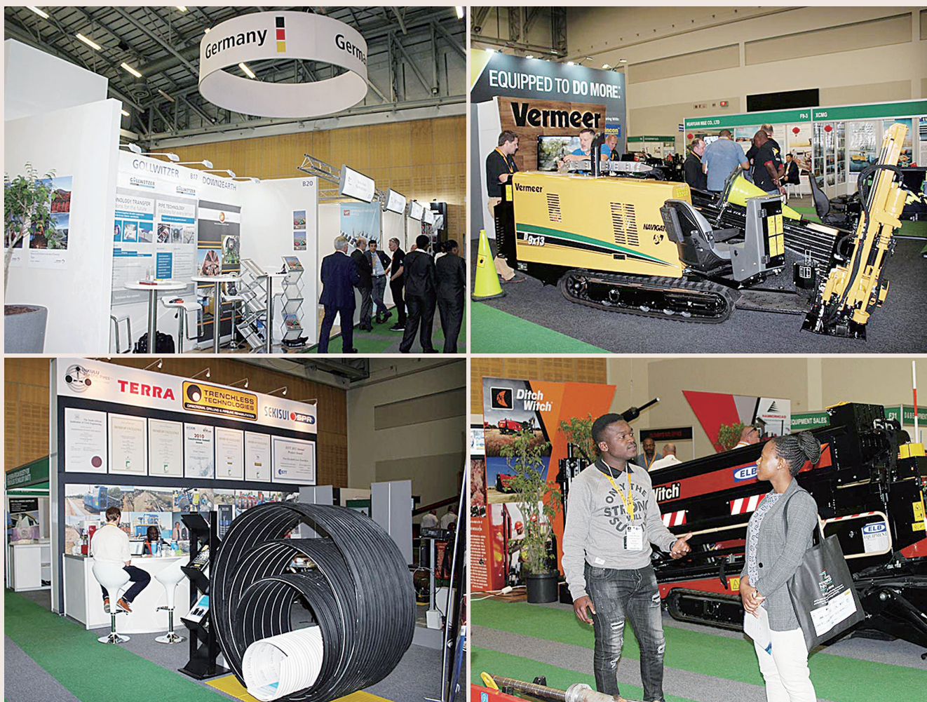
▲ 展示会の様子（出展状況は37社（団体））