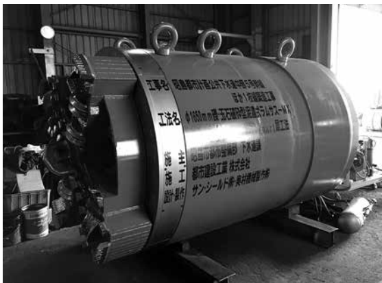
呼び径1650引き戻し掘進機

人びととインフラのあり方が、日々変化していく中、施工を通じて「人の安全を守る、人の暮らしを豊かにする」を当社の信条として、これからも社会に貢献する企業であり続けたいと考えております。