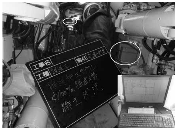
ジャイロシステムを用いた掘進精度の向上