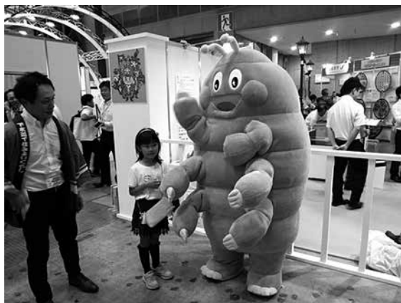
▲ 埼玉県の下水道マスコット クマムシくん

下水処理場で微生物を活用して汚泥処理をしている話は認識していましたが、通常コケの中に生息しているクマムシも含まれていて、そのキャラクターマスコットまで作ってPRしている埼玉県のコーナーがあったので、覗いてみました。クマムシを含む微生物