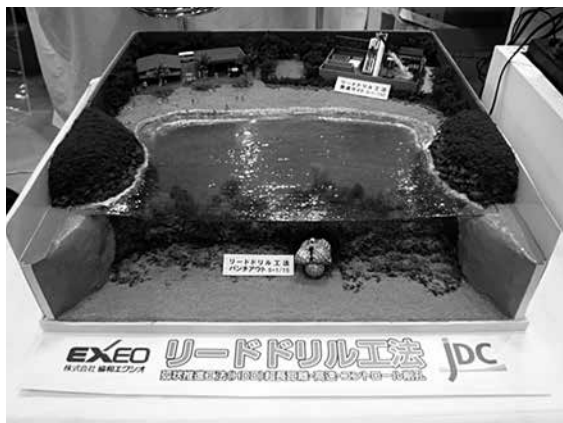
▲ リードドリル工法

リードドリル工法は弧状推進工法（HDD）の中でも長距離の実績を有するもので、海底通信ケーブルの陸揚げ管路設置工事やガス、水道など社会インフラの海洋や山岳の横断など約30の工事事例があります。その中には、シンガポールやインドネシアなど東南アジアの海外事例も含まれています。工事事例で最長のもは1,350mで地震・津波計測ケーブルの陸揚げ管路設置工事（徳島県）であり、どんな地質でも長距離の施工が出来るのが魅力です。施工手順はパイロット孔を掘削してリーマーで拡径して敷設管を引き込むというもので、全体の施工イメージの模型が展示されていました。