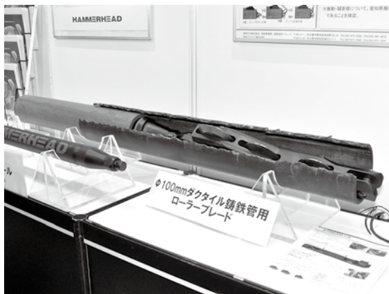
▲ ローラーブレード

このブースには、東邦ガス(株)が経年ガス管の敷設替え工法として使用しているSTREAM工法が展示されていました。この工法は、老朽化したダクタイル鑄鉄管のガス管を先導体装着した3つのブレードで延長方向に切り裂き、後続するエキスパンダで切り裂いたダクタイル管を拡径しPE管を敷設するものです。交通量の多い道路下の敷設替えには最適な非開削工法と言えます。