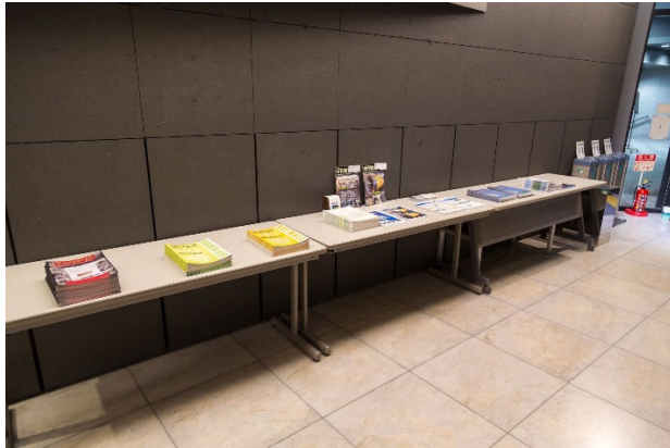
第 26 回非開削技術講演会の資料配布スペース (イメージ)